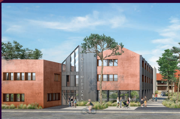
Centre médical Les Villes Dorées - Livraison 2022