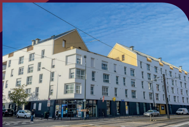
Résidence service seniors Steredenn - Livraison 2017