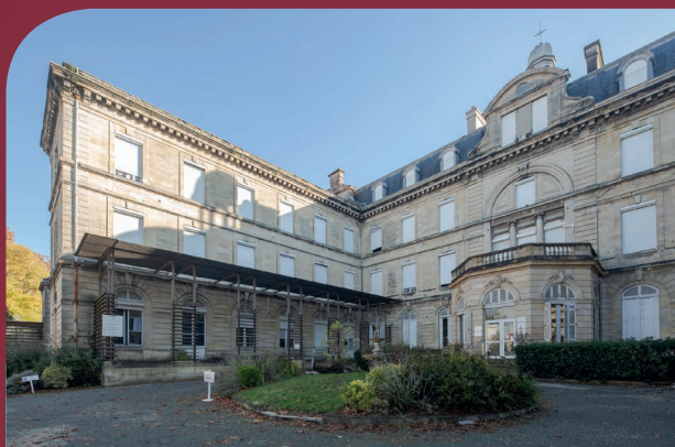
Crèche neuve et EHPAD Villa Pia - Livraison 2020