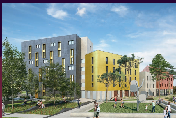
Résidence étudiante Les Villes Dorées - Livraison 2022